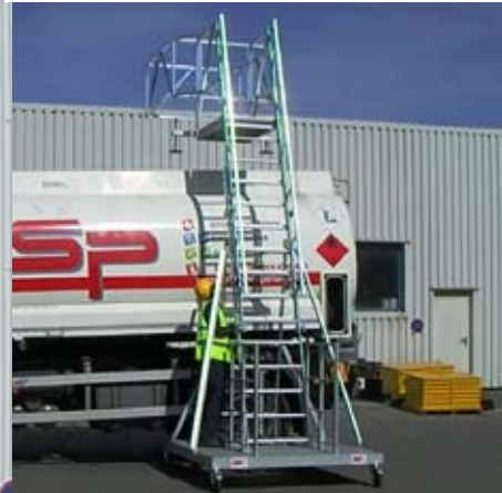
2. Hoogte instellen