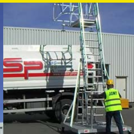
1. Zetten / Op locatie plaatsen