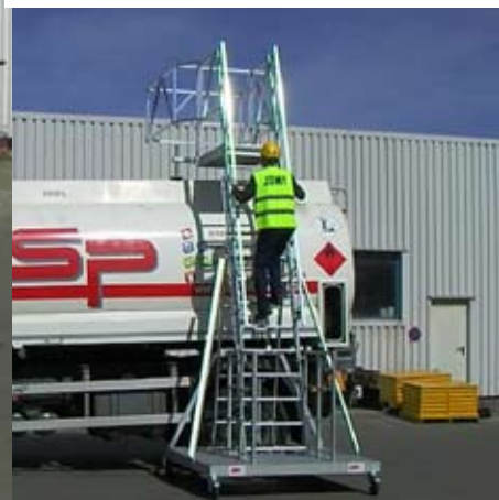
3. Betreden / Klimmen